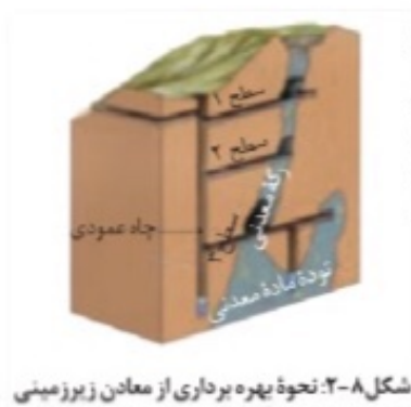
شکل ۸-۲: نحوه بهره برداری از معادن زیرزمینی

محصول نهایی (کنسانتره) برای جداسازی فلز به کارخانه ذوب، منتقل یا به طور مستقیم یا با تغییر اندک در صنعت استفاده می شود.