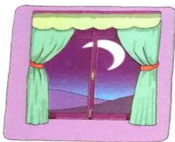
مغرب و عشا