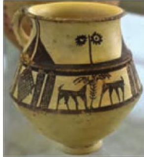
ظرف سفالی، ۳۰۰۰ ق.م - تپه گیان نهاوند

به تصاویر ظروف سفالی زیر و نیز تصاویر دیگری از ظروف سفالی دوره پیش از تاریخ که دبیر محترم به شما نشان می‌دهد به دقت توجه کنید و بگویید: