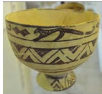
کاسه سفالی، ۴۰۰۰ ق.م - تپه حصار دامغان

الف) چه نوع تصاویری بر روی ظروف سفالی نقاشی شده است؟ تصاویر حیوانات و گیاهان ب) این تصاویر از چه جهاتی به باستان‌شناسان در تحلیل زندگی مردمان پیش از تاریخ کمک می‌کند؟ (دو مورد ذکر کنید) نوع ابزارآلات و نیازهای زمان و استفاده از آنها - شرایط اجتماعی و اقتصادی یک دوره - نگرش مردم آن منطقه و سطح فرهنگ و هنر